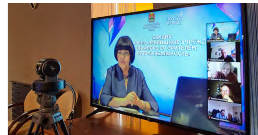
Прямой эфир заседания секции «Театрально-зрелищные учреждения в диалоге со зрителем: новая реальность» Межрегионального онлайн-форума «#Культура на дом – новая реальность».