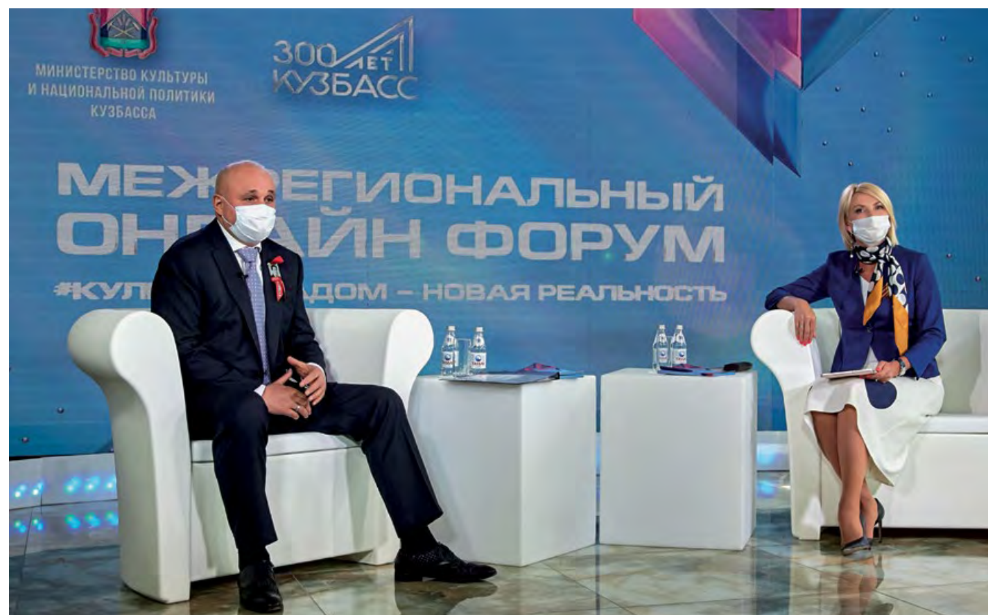
Губернатор Кузбасса Сергей Цивилев и министр культуры и национальной политики Кузбасса Марина Евса на открытии пленарной части Межрегионального онлайн-форума «#Культура на дом – новая реальность».

Специальный представитель Президента Российской Федерации по международному культурному сотрудничеству Михаил Швыдкой и заместитель министра культуры Российской Федерации Ольга Ярилова – спикеры пленарной части Межрегионального онлайн-форума «#Культура на дом – новая реальность».